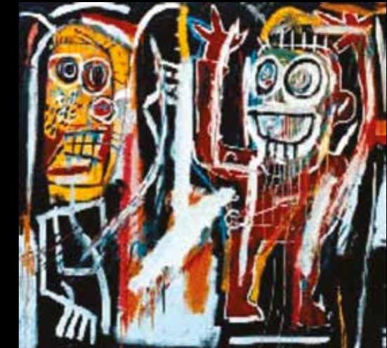
Jean-Michel Basquiat (1960-1988), Dustheads (1982)

Faculté de droit et de science politique